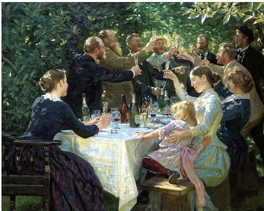
P.S. Krøyer, « Hip, hip, hourra », 1885-1888.

Huile sur toile, 135x166 cm, Göteborgs Konstmuseum, exposé au Musée Marmottan