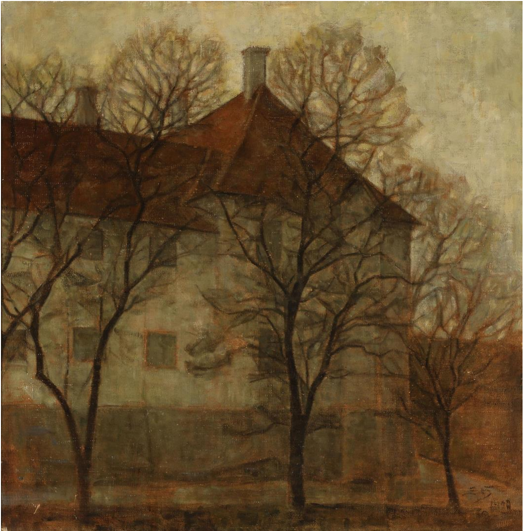
« Vue sur Holmegaard à travers des arbres dénudés », signé avec monogramme et 1922. Huile sur toile, 64x63 cm