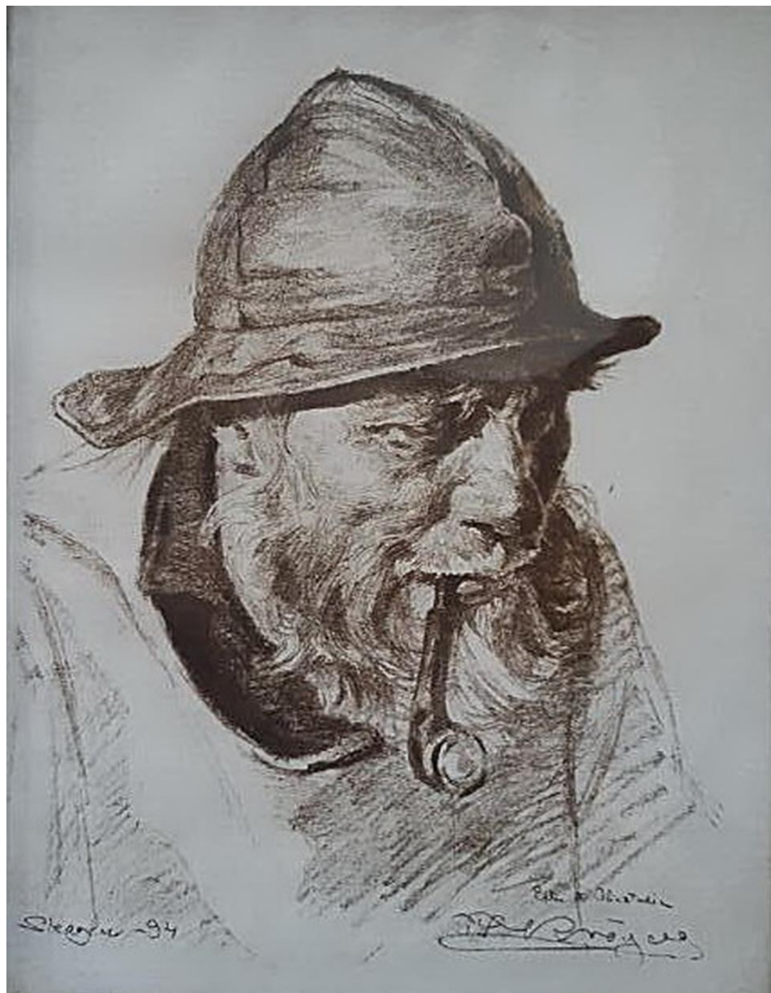
Peder Severin Krøyer, « Pêcheur à Skagen », 1894. Gravure sur papier, 30x25 cm