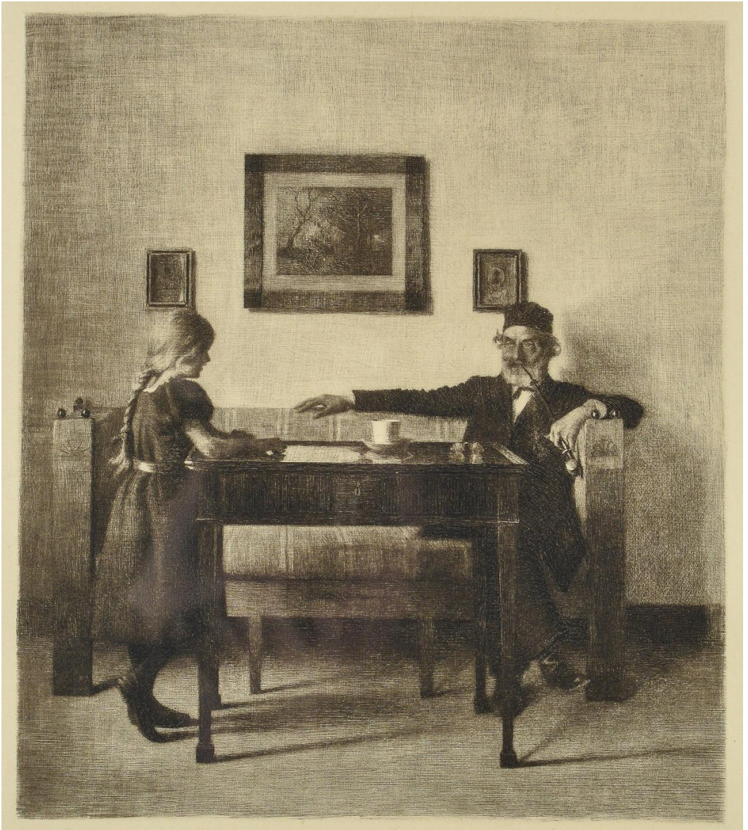
Peter Ilsted, « Chez grand père », Mezzotinte sur papier, 35x30 cm