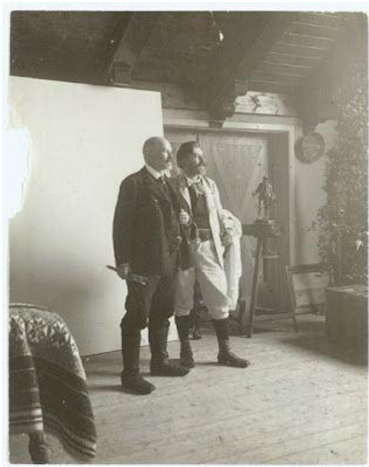
Michael Ancher et Peder Severin Krøyer.

Cette exposition de la galerie Anders hus sur les peintures d'atmosphère de Krøyer à Hammershøi se veut comme un livre ouvert sur la société danoise et ses coutumes de la fin du 19 ème siècle.