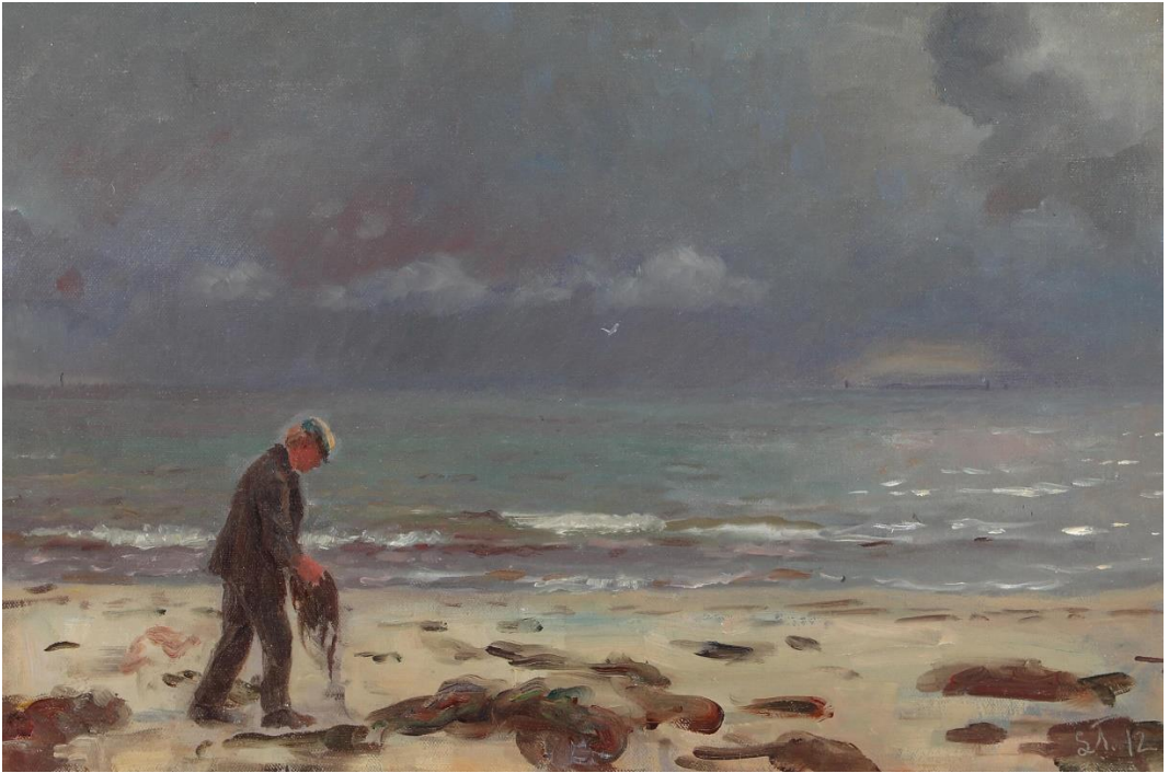
Laurits Tuxen, « L'homme qui cherche de l'ambre sur la plage de Skagen », 1912.