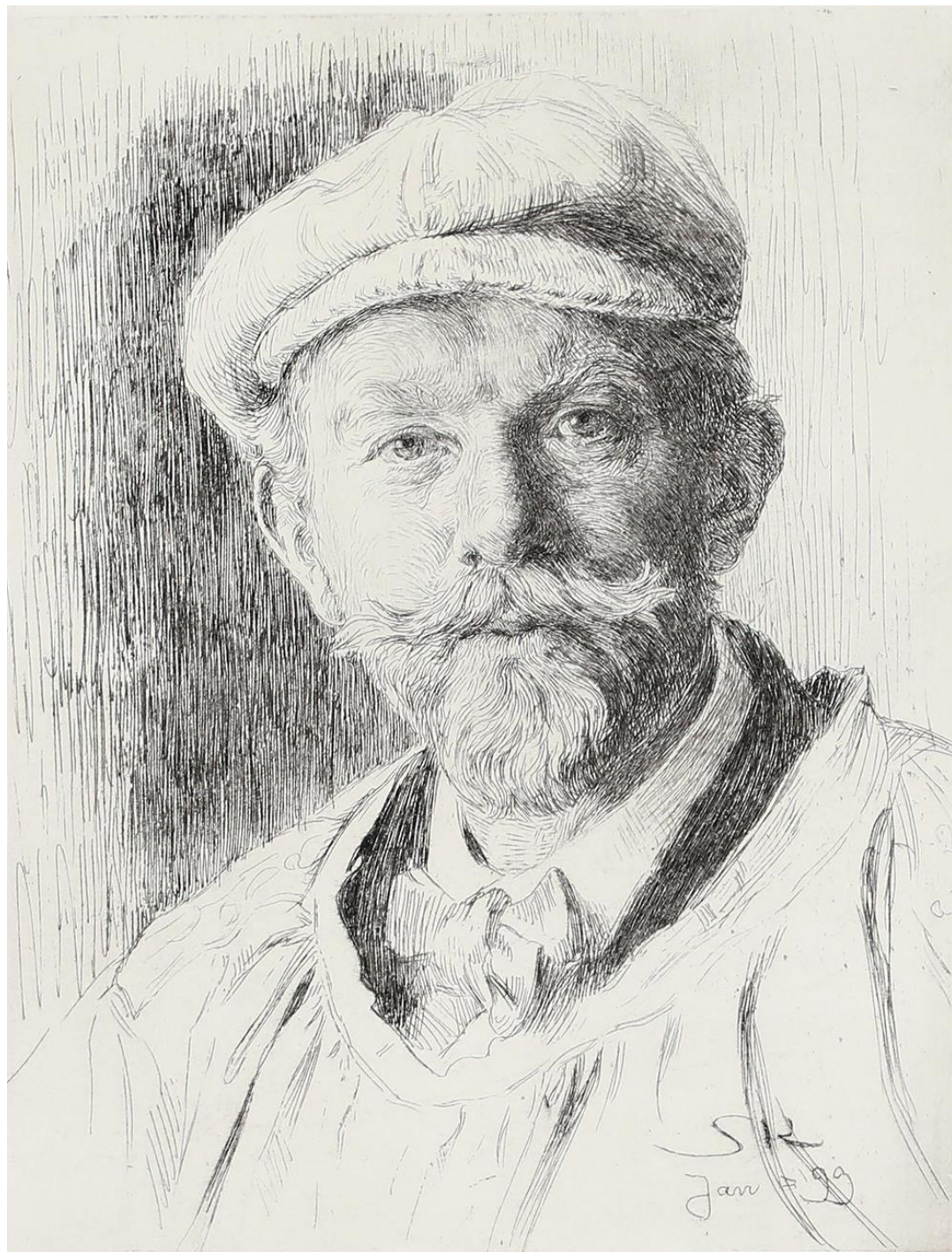
Peder Severin Krøyer, 1851-1909, « Autoportrait », 1899. Gravure sur papier, 41x32 cm