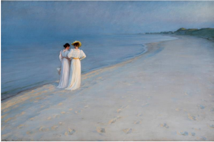
Marie Krøyer et Anna Ancher sur la plage de Skagen (Exposition « L'heure bleue » au Musée Marmottan)

Quand on parle de la lumière particulière et des couleurs du Nord, il ne s'agit pas d'un pur phénomène culturel créé dans les pays scandinaves. Il y a une explication scientifique. En raison de sa trajectoire particulière dans le ciel, en été, le soleil reste longtemps bas le matin et le soir. Ses rayons doivent donc parcourir un plus long trajet à travers la brume avant d'atteindre la terre ou le promeneur le matin et en fin d'après-midi. De ce fait, le crépuscule dure plus longtemps. Les nuits d'été claires s'expliquent par le fait que, durant une partie de cette saison, le soleil ne descend pas au-delà de dix-huit degrés sous l'horizon. À cette période, le soleil peut donc éclairer les couches supérieures de l'atmosphère et, via les molécules qui s'y trouvent, diffuser sa lumière dans le ciel, si bien que la nuit paraît claire. La période des nuits claires est, même dans un petit pays comme le Danemark, sensiblement plus longue quand on monte vers le nord. Skagen est donc idéalement situé puisque le phénomène s'y produit du 28 avril au 14 août, tandis qu'à Copenhague, il ne dure que du 5 mai au 7 août. On a donc quatorze jours de plus pour profiter à Skagen de nuits plus claires qu'à Copenhague. De plus, avec la pleine lune, si l'on se trouve sur la plage, où la lumière se reflète dans l'eau, la nuit est totalement claire. C'est ce qui frappe Krøyer dès la première année où il découvre Skagen.