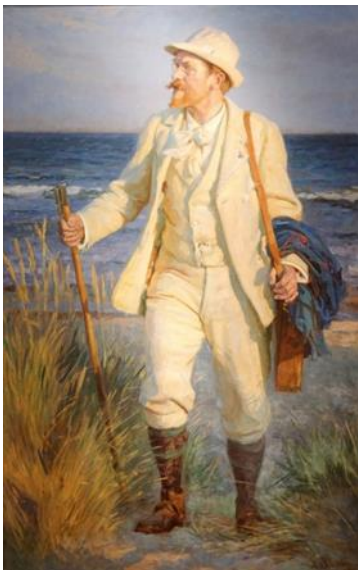
Portrait de Krøyer par Tuxen, Musée Marmottan, 2021

Laurits Tuxen (1853-1927), peintre et sculpteur danois, ami proche de Peder Severin Krøyer, fait partie des artistes majeurs de l'école de Skagen. Tuxen a grandi à Copenhague, sa ville natale et a fait ses études à l'Académie royale des Beaux-Arts du Danemark. En 1870, il découvre la petite station balnéaire de Skagen, où il retournera fréquemment et y possédera une résidence d'été. Laurits Tuxen a peint de nombreux paysages de Skagen et de ses environs : la mer, les jardins en fleurs, des portraits de sa famille, de ses amis. Il est aussi connu comme peintre officiel auprès de personnalités royales européennes. En 2014, le Musée d'Art de Skagen, qui expose de nouveaux aspects du travail des peintres de Skagen, concentre ses efforts sur Laurits Tuxen « Couleur, campagne, couronne ». Présentant de nombreuses œuvres conservées dans les collections privées, le Musée illustre ainsi l'implication de Tuxen dans la création de la « Kunsternes Studeskole » à Copenhague, ainsi que son travail de peintre de cour.