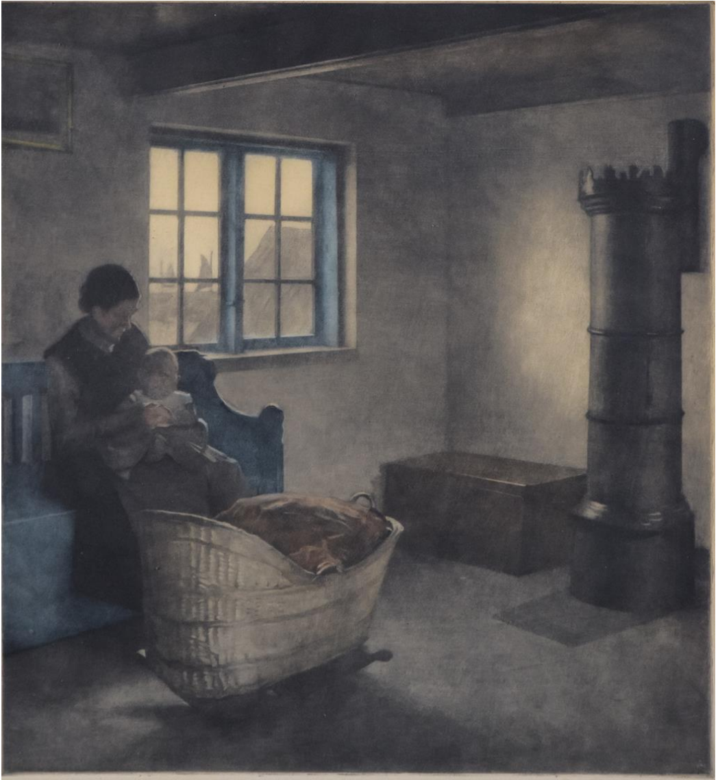
Peter Ilsted, « Maison de pêcheur à Hornbæk », ca. 1930. Mezzotinte sur papier, 57x53 cm

Une femme et son petit enfant blotti sur ses genoux sont assis près de la fenêtre. On aperçoit les bateaux dans le port d'Hornbæk à travers les vitres. Ici la pièce est modeste, c'est une maison de pêcheurs. Le grand poêle en fonte noire, comme on en voit encore au Danemark, permet de chauffer toute la maison.