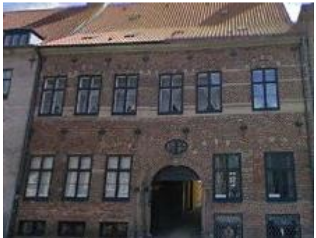
30 Strandgade Copenhagen

La plupart des œuvres de Vilhelm Hammershøi représentent son appartement austère du 30 Strandgade à Copenhague. Là même où Krøyer a vécu dans son enfance !